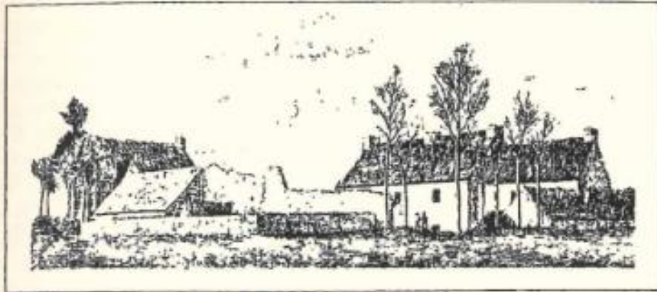
Manoir de Pontplaincoët

chemin de Plouescat et qui existait dès le XV e siècle. Son mur d'enceinte est crénelé et muni de contreforts, ce qui lui donne un aspect de forteresse. Jadis, un pavillon à trois étages surmontait le portail ; on y accédait par une tourelle encore visible, avec sa porte gothique et sa meurtrière, à l'angle sud-ouest de la cour."