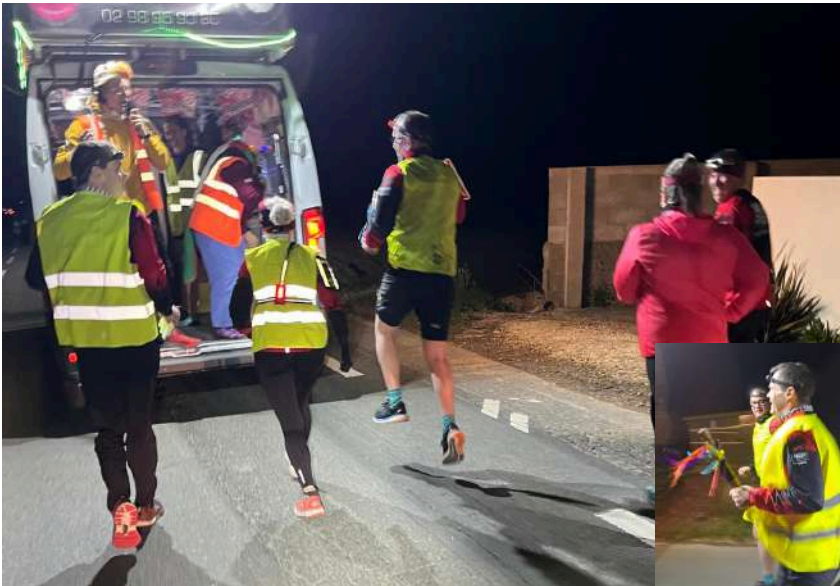
Photo : la caravane de la Redadeg accompagne les coureurs.