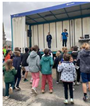
← Séance d'échauffement avant le départ